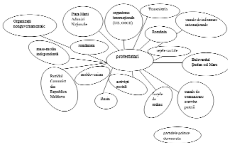
Figura 2. Secțiune a hărții situaționale, care surprinde legăturile dintre protestatari și alte „universuri de discurs“