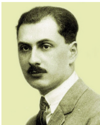
GHEORGHE I. BRĂTIANU